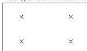
Fig. 1 : Plaatsingspatroon voor de mechanische bevestigingen (minimum 4 bevestigingen per plaat voor platen met afmetingen van 1200 mm x 1000 mm)