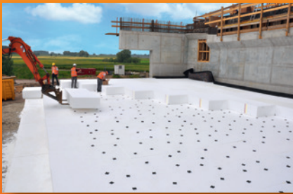
algemene toepassingen (bijvoorbeeld GWW)