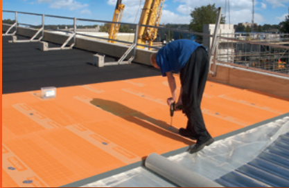
plat dak isolatie