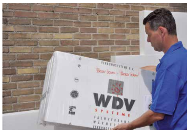
PolyStuc® un produit fiable et de qualité

PolyStuc® et PolyStuc HR ® sont livrés conformément aux directives IVH et « Fachverband WDVS ».