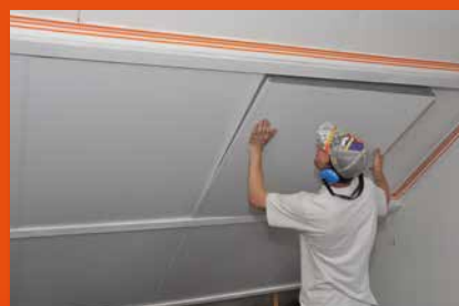
Isolation de plafond