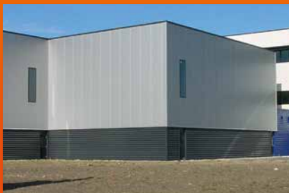
Panneaux sandwich en acier