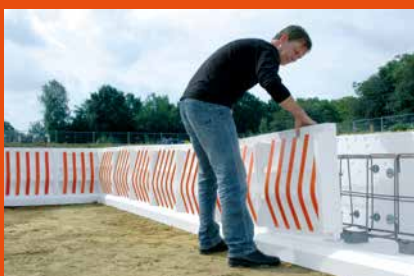
Coffrage de fondation