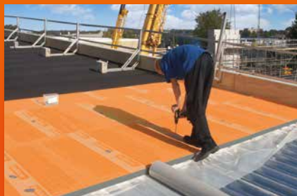
Isolation de toit plat