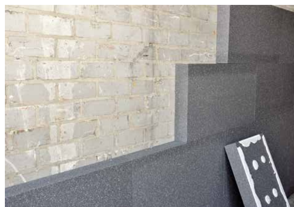
PolyStuc HR ® jusqu'à 20 % plus isolant