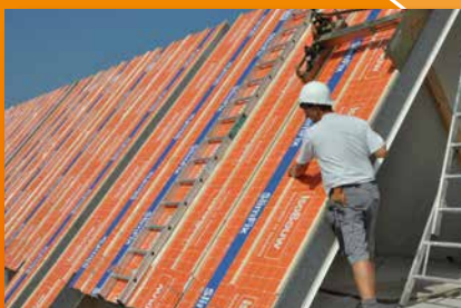
éléments de toit