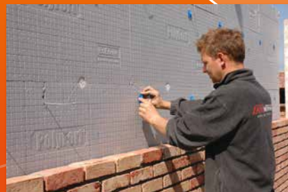
Isolation des murs creux