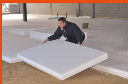
Isolation de sol